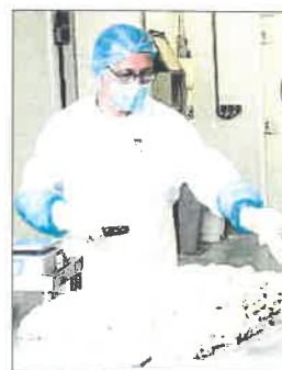
Una empresa alimentaria