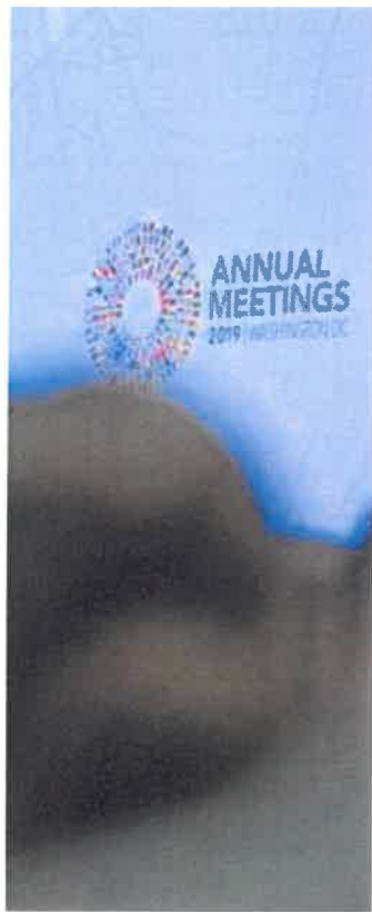
■ NICHOLAS KAMM/AFP

Por comunidades, el informe revela que la industria en cinco de las 17 presenta una contribución inferior al PIB al de la media estatal, entre las que destacan —quizá por el peso del sector turístico— Baleares y Canarias, que no superan el 7%. Solo seis están por encima del umbral del 20%, entre las que destacan Navarra, País Vasco y La Rioja.