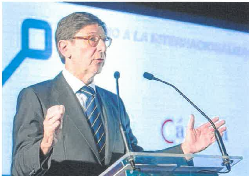
El presidente de Bankia, José Ignacio Goirigolzarri.