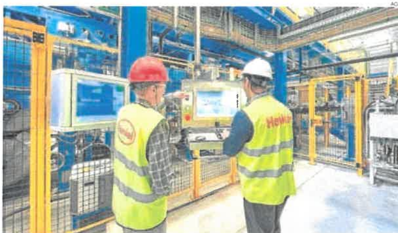
► Dos trabajadores de la fábrica de Henkel, en Montornès del Vallès.

España es la quinta nación europea en cuanto a volumen de facturación del sector industrial (538.655 millones de euros) por