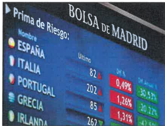
Panel informativo de la Bolsa española. CHEMA MOYA

En su último informe de julio, el FMI pronosticaba un crecimiento del PIB mundial del 3,2% en 2019 y del 3,5% en 2020, una décima menos de lo estimado tres meses antes debido a las tensiones comerciales crecientes. Tras el verano, el recrudescimiento de las relaciones comerciales entre las dos mayores potencias mun-