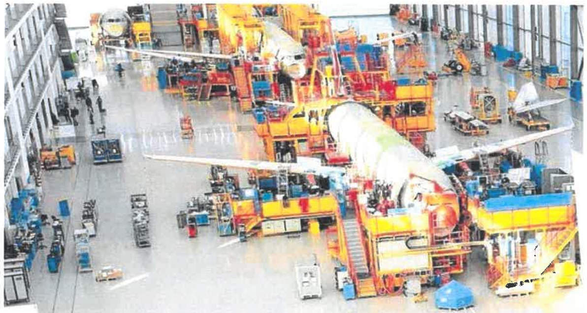
Estados Unidos quiere imponer un arancel adicional del 10% a los aviones Airbus que se venden en Estados Unidos.

Curiosamente estas medidas arancelarias no son uno de los abusos unilaterales que la actual administración norteamericana de Trump está imponiendo y generando, según el FMI, un notorio perjuicio al comercio internacional y al crecimiento económico