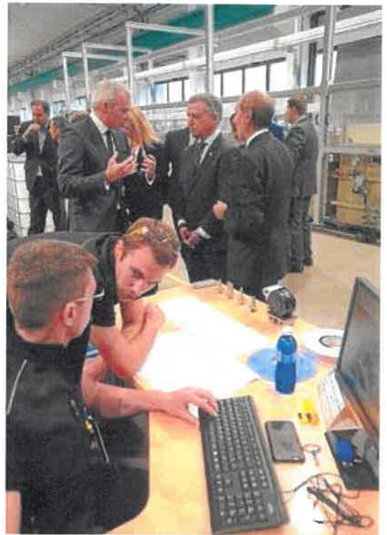
Urkullu, en una reciente visita a la firma Egile.

Mañana le tocará el turno al sector vitivinícola. El Gobierno Vasco, tal y como anunció el lunes Arantxa Tapia y reiteró ayer el portavoz del Ejecutivo, Josu Erkoreka, trasladará al sector su intención de impulsar la diversificación de las exportaciones para paliar de esta manera la dependencia excesiva de Estados Unidos, el segundo cliente de las bodegas de La Rioja alavesa y el primero de las de txakoli. En el caso de La Rioja los aranceles del 25% tendrían un impacto sensible en los balances, no así en el txakoli, dado que las ventas a EE UU son muy reducidas respecto del total.