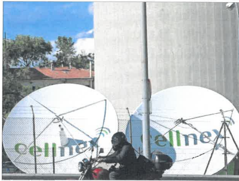
Dos antenas de Cellnex en las instalaciones de Torrespaña, en Madrid.

Villarejo, que denominó Proyecto Arrow la operación, rastreó a los miembros de la corporación, regida por el PSOE con el apoyo de IU. Finalmente, la planta, valorada en 1.000 millones, se construyó. Fuentes de la empresa han declinado hacer comentarios sobre este asunto.