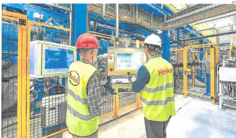
► Dos trabajadores de la fábrica de Henkel, en Montornès del Vallès.

La industria española sigue perdiendo peso y cada vez se aleja más del objetivo del 20% del PIB pretendido por la Unión Europea. Así, si en el año 2000 el sector industrial representaba el 18,7% de la economía española, en el 2018 esta tasa cayó hasta el 16% del PIB, según un informe del Consejo General de Colegios Oficiales de Ingenieros Industriales (COGITI) y del Consejo General de Economistas de España. El problema se agrava en el caso de la industria manufacturera (aquella que se dedica a la transformación de materias primas en productos terminados, como por ejemplo, la industria alimentaria, química o textil) que ha pasado del 16,2% al 12,6% del PIB en dicho periodo.