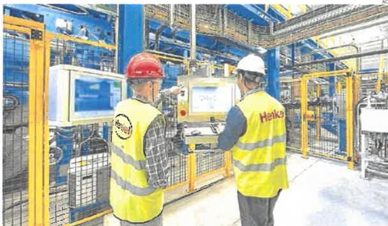
▶ Dos trabajadores de la fábrica de Henkel, en Montornés del Vallés.

España es la quinta nación europea en cuanto a volumen de facturación del sector industrial (538.655 millones de euros) por