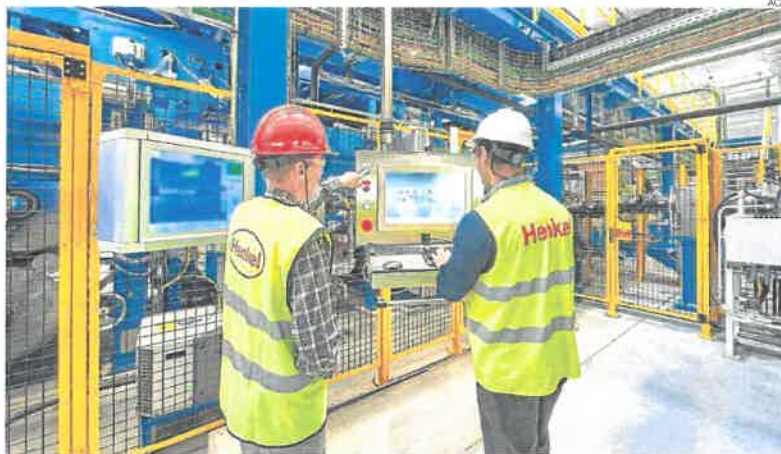
▶ Dos trabajadores de la fábrica de Henkel, en Montornès del Vallès.

España es la quinta nación europea en cuanto a volumen de facturación del sector industrial (538.655 millones de euros) por