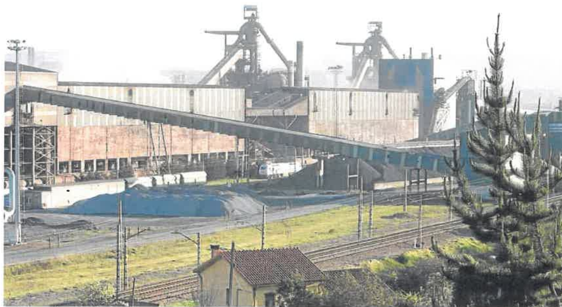
Los hornos altos de la factoría de ArcelorMittal en Gijón, cuya actividad pierde competitividad.

En realidad, esta situación ya se está adelantando. Con el incremento del precio de los derechos de CO2 —en la actualidad cotiza a 23,78 euros la tonelada, cuando la media de 2017 fue de 5,83 euros y la de 2018 de 15,88— ya hay parte de la producción que no interesa hacerla aquí. La multinacional cifra en 1,75 toneladas de CO2 las necesarias en Asturias para producir una tonelada de acero, lo que