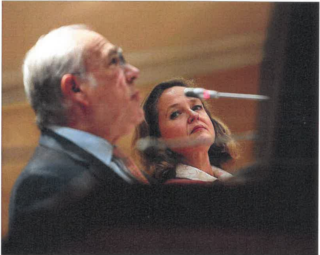
El secretario general de la OCDE, Ángel Gurría, y la ministra de Economía en funciones, Nadia Calviño, en un acto en Madrid.

En concreto, en la actualización de septiembre de su informe Perspectivas económicas , la OCDE re-