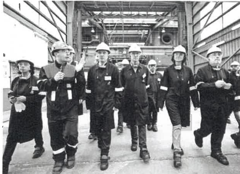
La ministra de Industria en funciones, Reyes Maroto, y el presidente de la Xunta, Alberto Núñez Feijóo, visita ayer el complejo industrial de Alcoa en San Ciprián (Lugo).

Así, las cifras de España quedan lejos del objetivo de la UE para 2020, que se fija en el 20% del PIB, por lo que ingenieros y economistas piden actuar de forma consensuada dentro de un "pacto