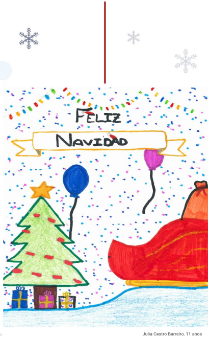
Julia Castro Barreiro, 11 anos

Un año más, desde el Colegio se organizó el tradicional Concurso de Postales Navideñas, en su tercera edición, con un total de 11 participantes, realizándose el acto de entrega de galardones el día 16 de enero por vía telemática. Los trabajos premiados se utilizaron para ilustrar la felicitación navideña oficial del Colegio.